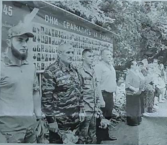
► Станица Старопавловская.