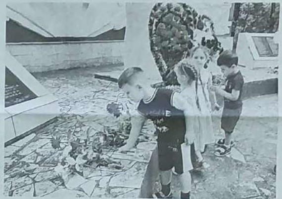
► Посёлок Коммажк.

В посёлке Прогрессе прошёл патриотический час, где дети читали стихи, посвящённые Великой Отечественной войне, по-