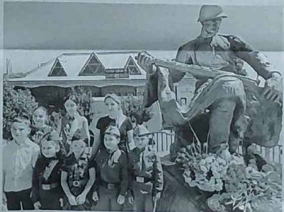
► Посёлок Прогресс.

сле чего была объявлена минута молчания и возложены цветы к памятнику. А участниками