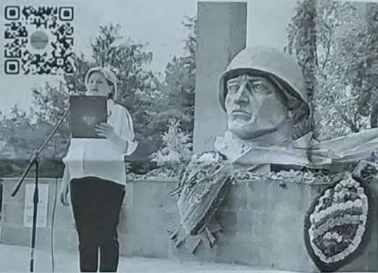
► Село Горнозаводское.

В Марьинской библиотеке в рамках краевой галереи прошёл исторический час «Память павшим». Ребята послушали рассказ о «Героях Зв»: о подвигах героев России, совершённых