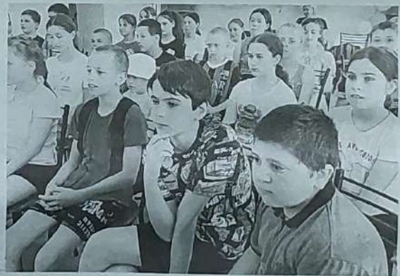
► Посёлок Комсомолец.