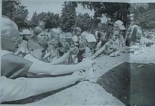
► Город Новопавловск.